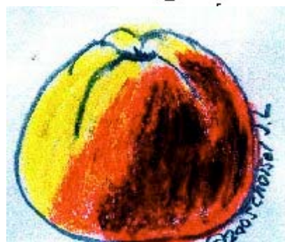
Pastel Choisel Jean-Louis ©2005.

ORIGINE : Décrite par les pomologues allemands Diel et Lucas. Ce dernier , directeur de l'Institut pomologique de Reutlingen ,en Wurtemberg , écrivait que cette variété était cultivée le long du Rhin , dans champs et chemins , en Franconie , Palatinat , Wurtemberg , duché de Bade. On pourrait la trouver en Alsace.